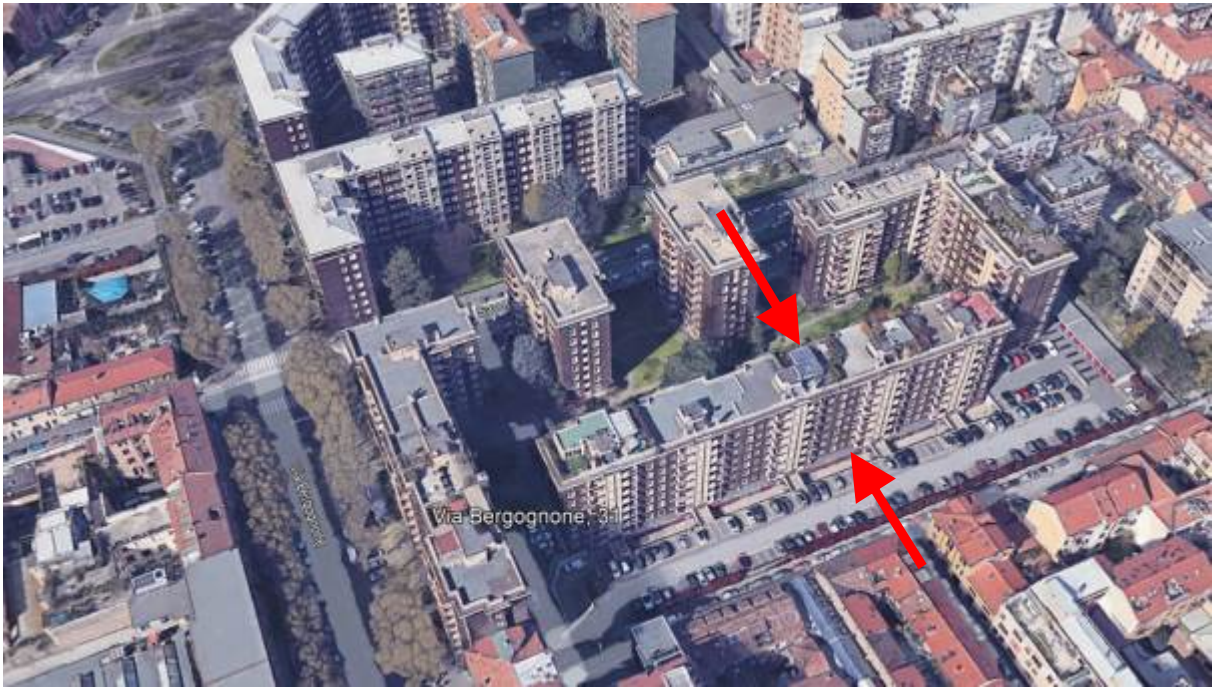
3. Vista aerea del contesto con individuazione degli affacci dell'immobile.