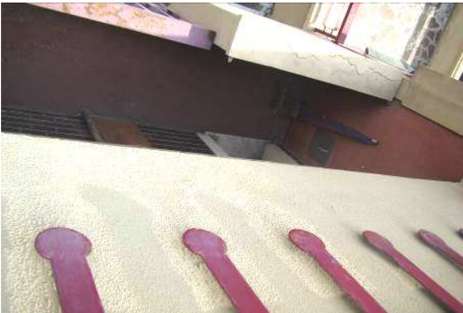
16. Vista del balcone dall'alto.