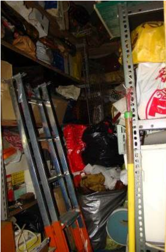
21. Vista interna della cantina.