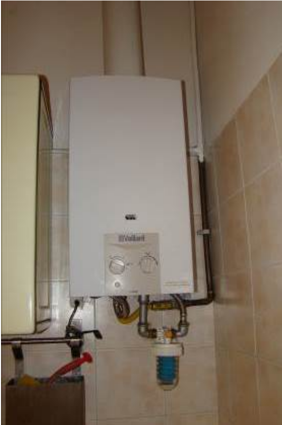
17. Dettaglio della caldaietta per la produzione dell'acqua calda.