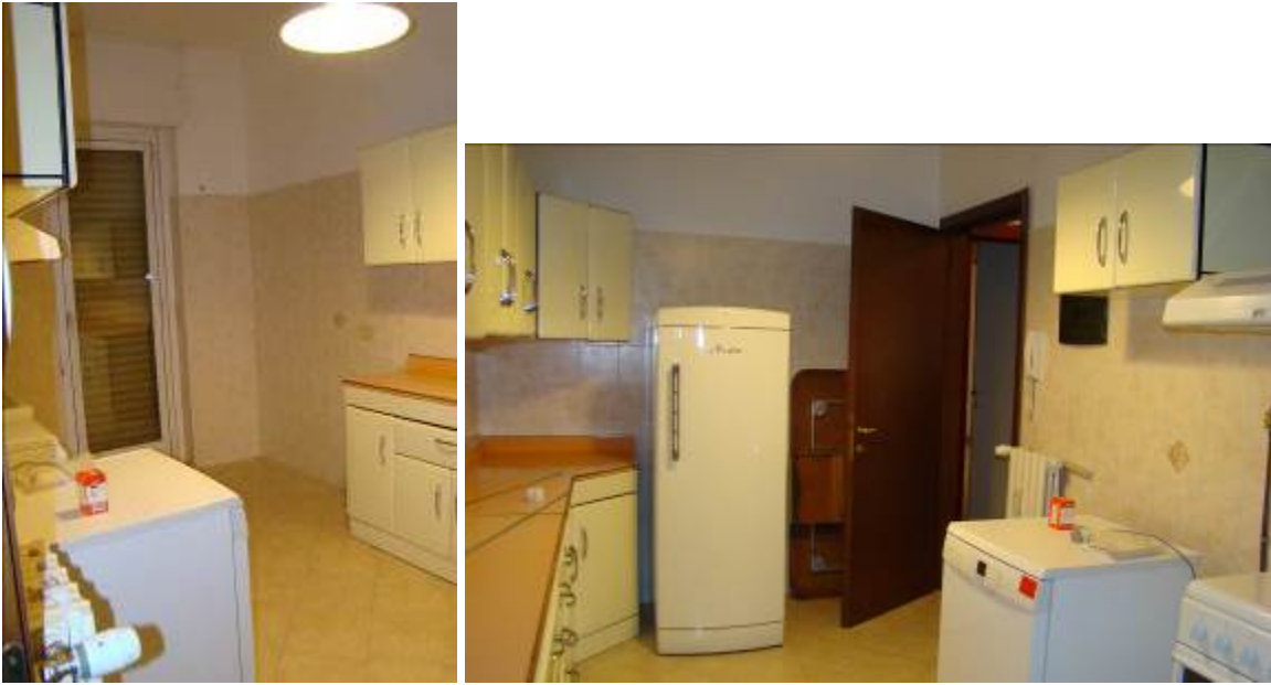
15. Viste della cucina.