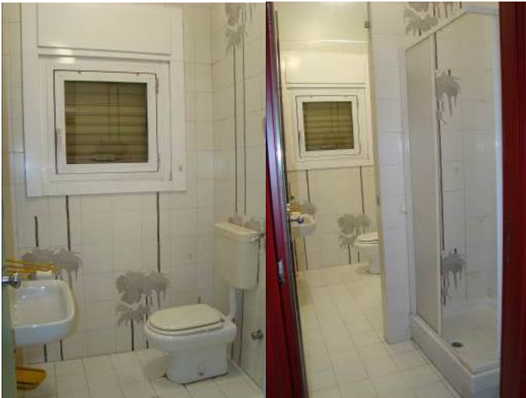
13. Viste del bagno.