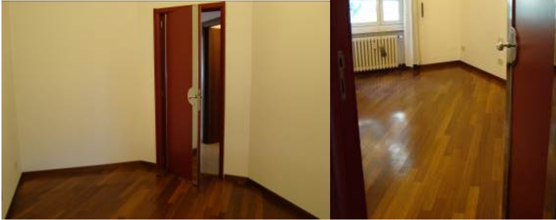
11. Viste della camera.