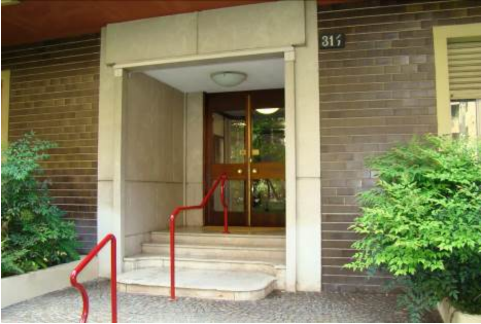
3. Rilievo fotografico del contesto. Vista dell'accesso alla scala di pertinenza.