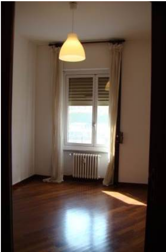
12. Vista dell'altra camera.