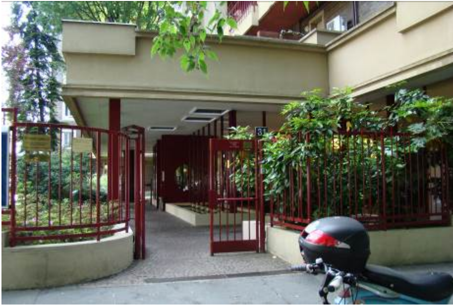
1. Rilievo fotografico del contesto. Vista dell'ingresso pedonale su strada.