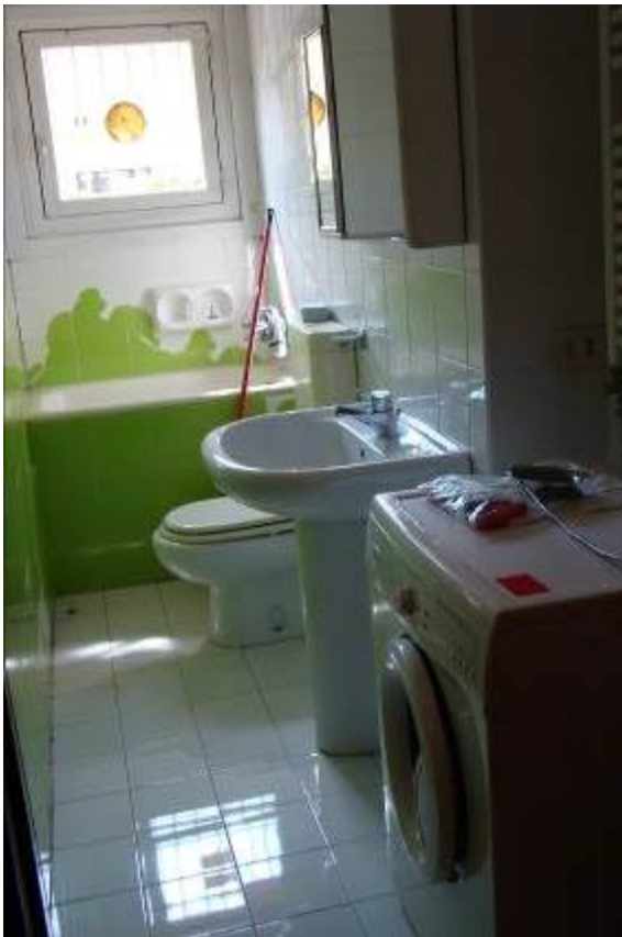
14. Vista dell'altro bagno.