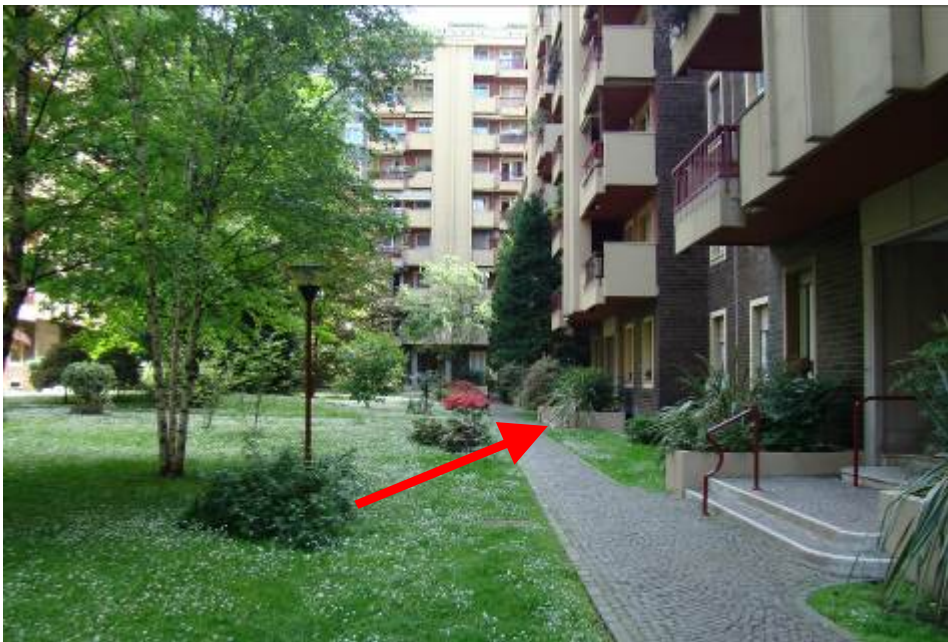
2. Rilievo fotografico del contesto. Vista del cortile interno con individuazione della scala di pertinenza.