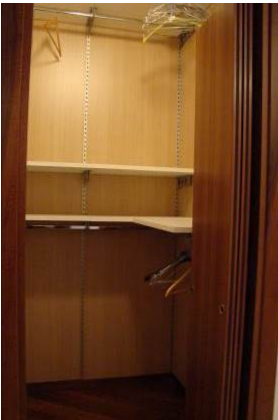
10. Vista dell'altro ripostiglio utilizzato come guardaroba.