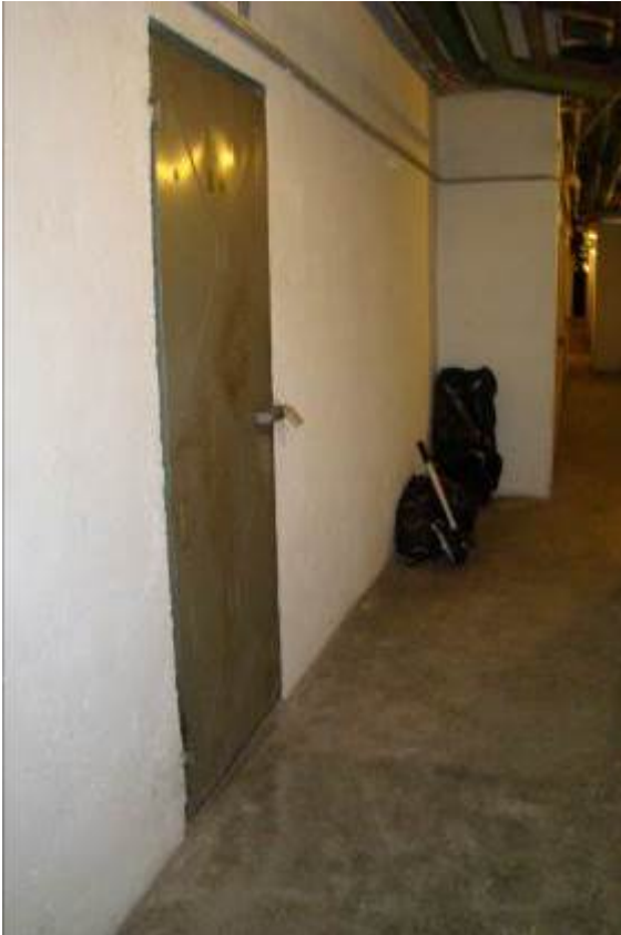
20. Individuazione della cantina.