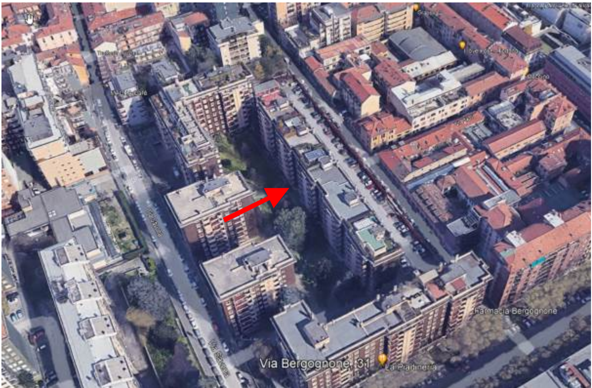
4. Vista aerea del contesto con individuazione degli affacci dell'immobile sul cortile interno.