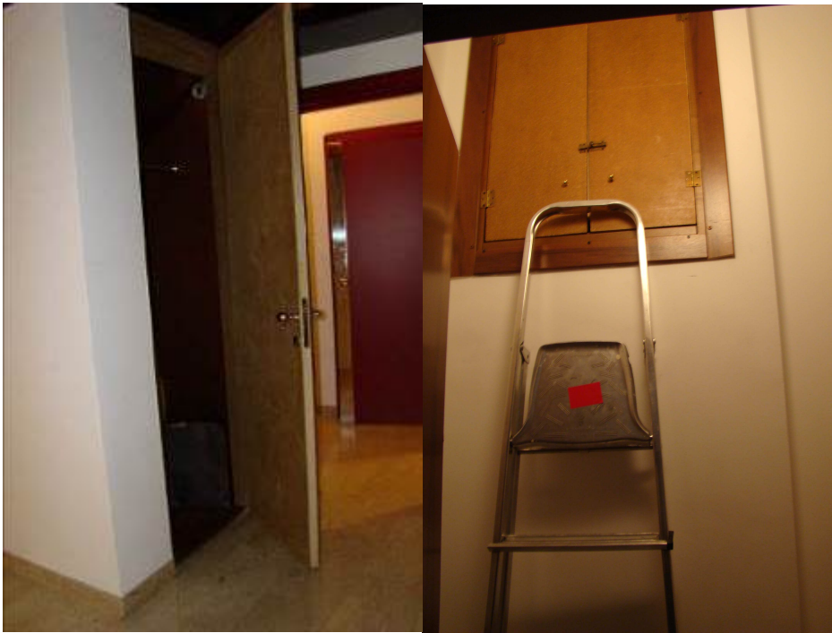
9. Vista del disimpegno e del ripostiglio.