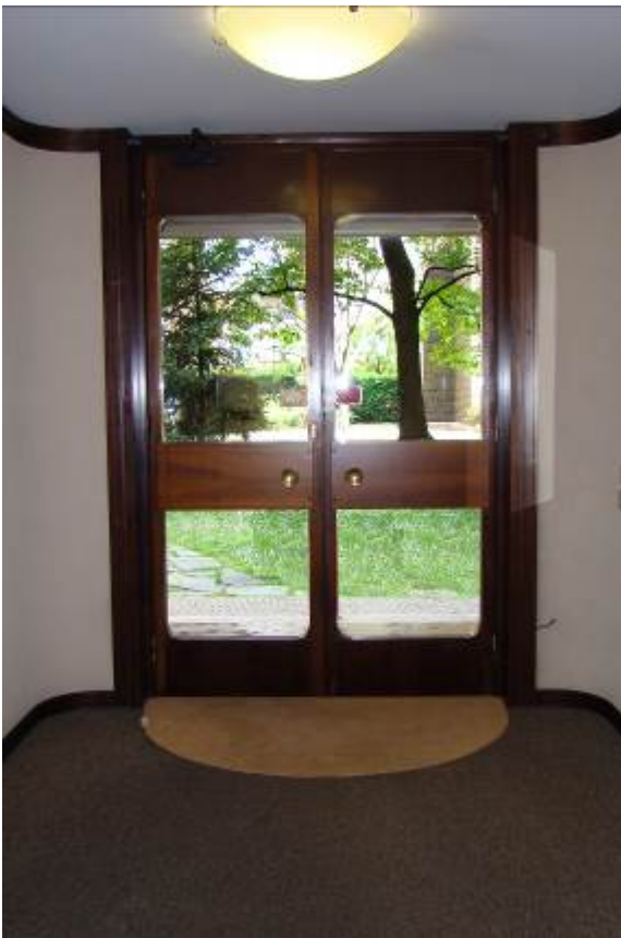
4. Dettaglio del portone di ingresso al palazzo.