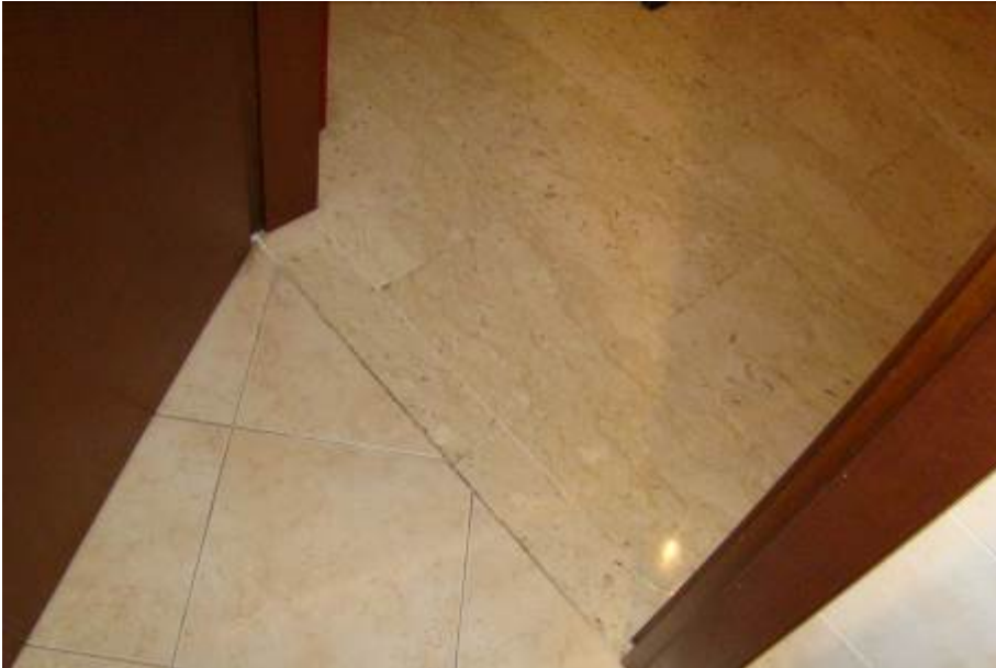
18. Dettaglio del pavimento tra ingresso e cucina.