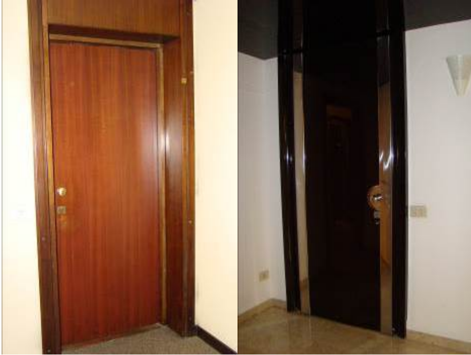
5. Vista della porta di accesso all'alloggio, dal pianerottolo e dall'interno.