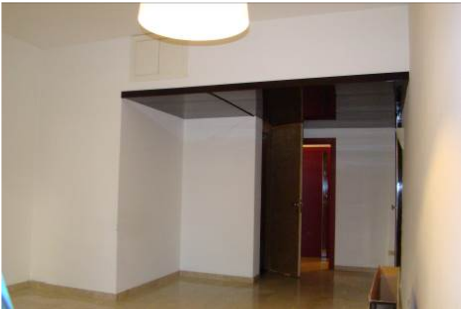
6. Vista dell'ingresso con il ribassamento e il ripostiglio in quota.