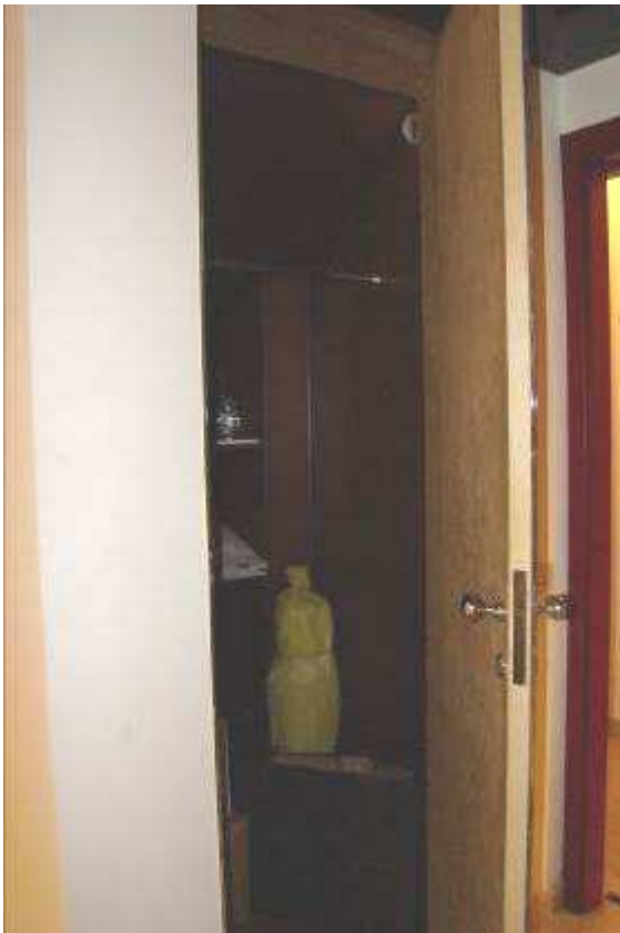
8. Vista del ripostiglio.