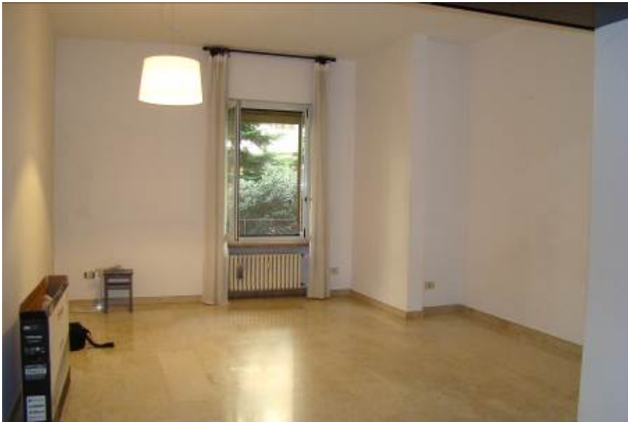
7. Vista del soggiorno.